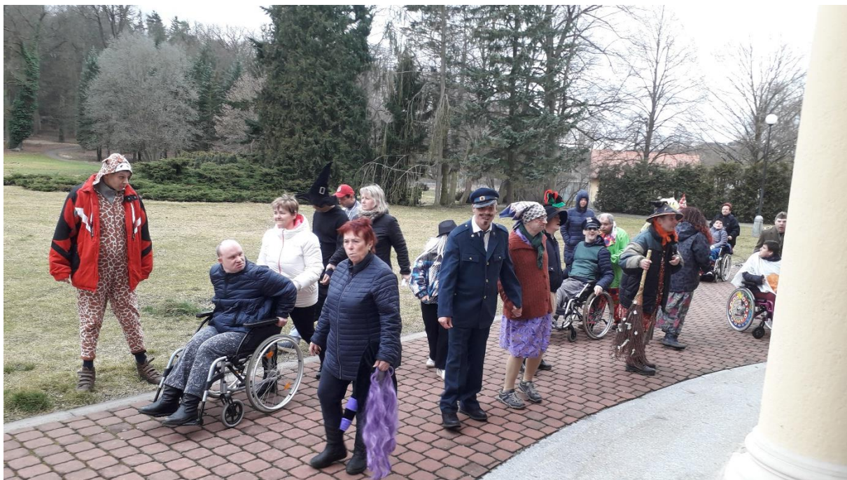
Vycházky do parku a jeho okolí